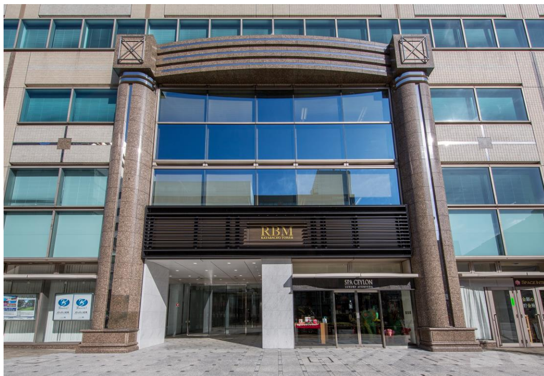
エントランス・エレベーターホール 2023年1月リニューアル済